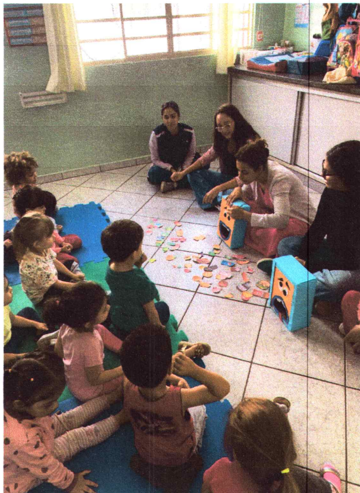
Festa do pijama